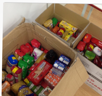
RECOGIDA DE ALIMENTOS